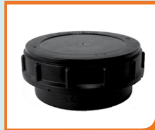
Art. Nr. 66 11 20