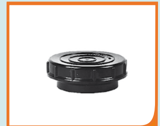
Art. Nr. 66 11 00